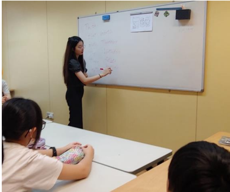
我是在大围成长发展中心担任英语拼音导师， 以有趣的方式教导小学生英语拼音